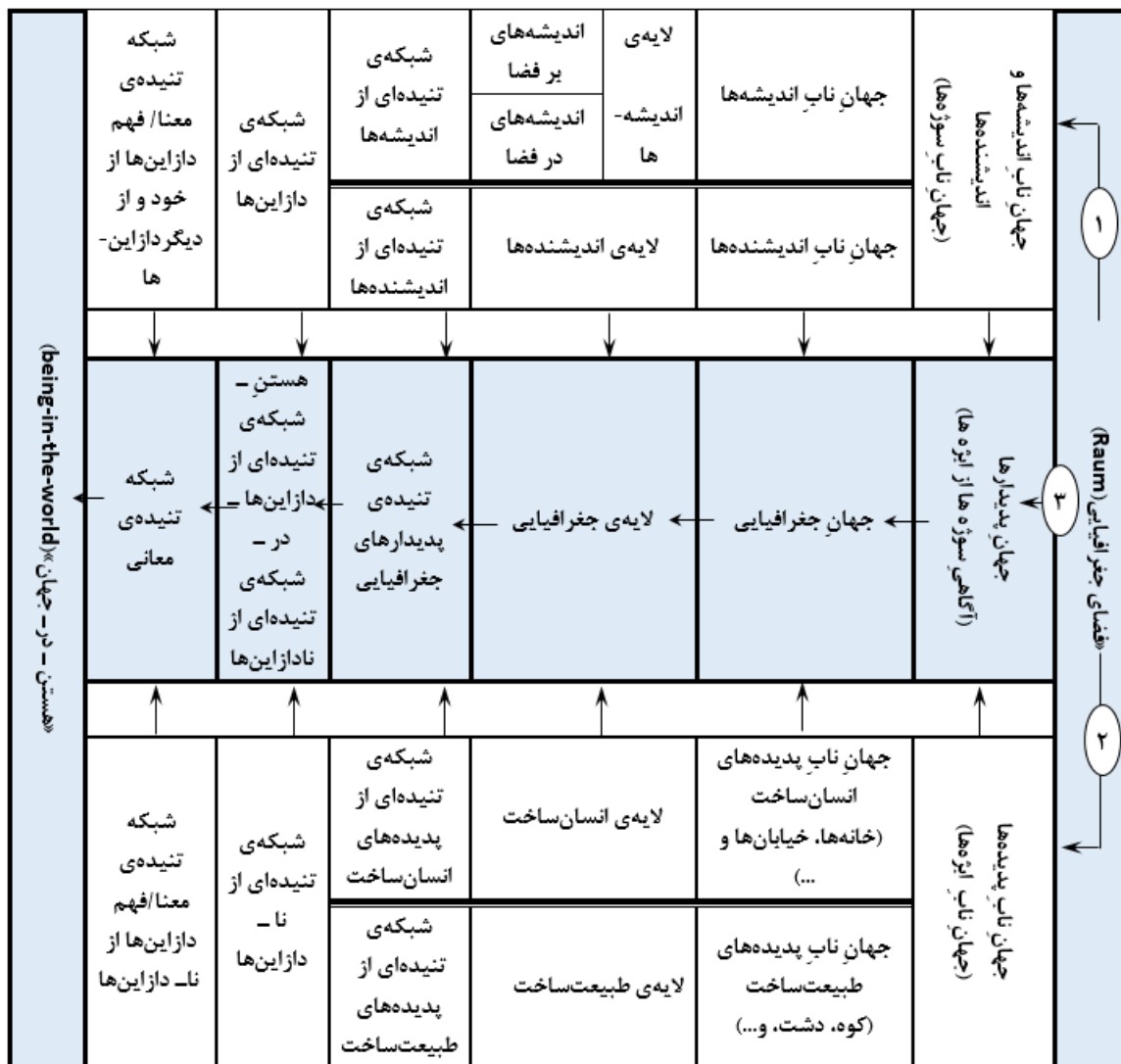
شکل ۴: دستگاه برهان‌های فلسفی - جغرافیایی

اگر با همان الگوی سوژه - ایزه‌ی سنتی که در آن سوژه‌ی مشاهده‌گر در برابر جهانی متشکل از جمیع هستندگان ایستاده است (ملاپری، ۱۳۹۰: ۲۱۸) به فضای جغرافیایی (Raum) بنگریم، می‌توان آن را - در ذهن، و نه در واقعیت -