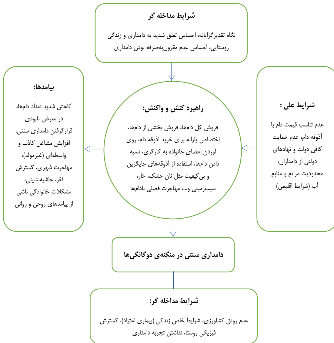
شکل ۲. الگوی پارادایمی بازسازی معنایی بحران آب و پدیده خشکسالی در منطقه موسی‌آباد تربت‌جام