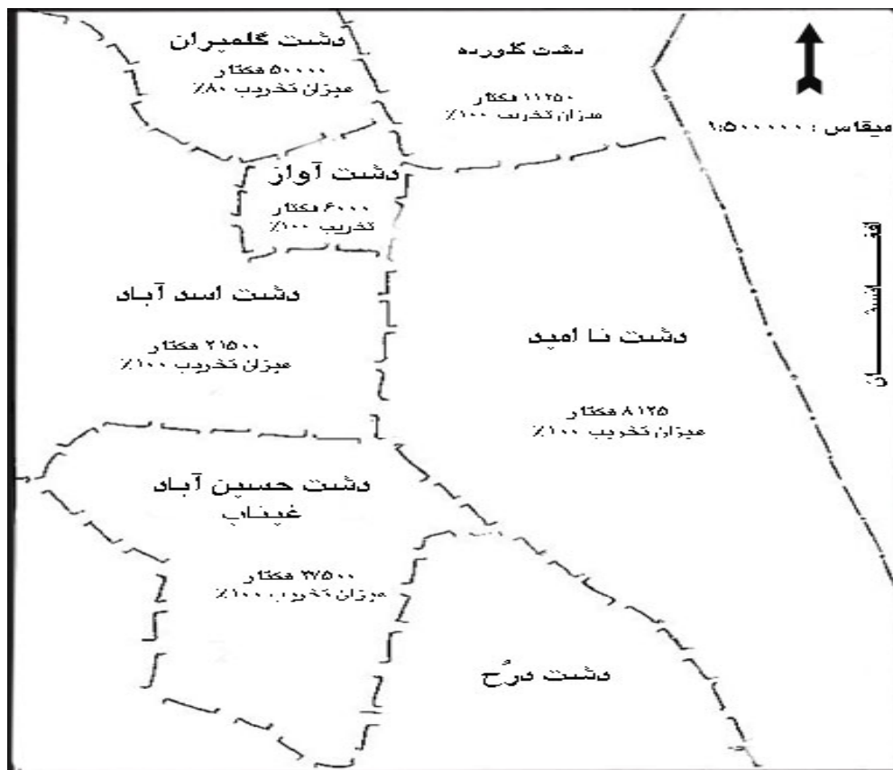
شکل شماره ۱ - نقشه میزان اراضی تخریب شده شرق استان خراسان جنوبی توسط پناهندگان افغانی منبع: فال سلیمان، ۱۳۶۷: ۳۰

گرفته و به منظور مدیریت مشارکتی احیا مراتع، فعالیت‌های متنوعی در خصوص توسعه اقتصادی و اجتماعی جوامع محلی با تکیه بر اصل مدیریت مشارکت جویانه و افزایش ظرفیت این جوامع انجام گردیده است. مدل مدیریت مشارکتی بر پایه اصول بسیج جوامع محلی، به گونه‌ای طراحی شده که مردم محلی بتوانند قابلیت‌های خود را بایکدیگر در راستای بهبود وضعیت اقتصادی و اجتماعی و مدیریت پایدار مراتع مهار نمایند. (The bureau of carbon sequestration project -2004:25) مردم محلی به مشارکت در همه‌ی مراحل اجرایی پروژه تشویق شدند به نحوی که با واگذاری مسئولیت این برنامه‌ریزی محلی قادر باشند مناطق تخریب شده را احیا نموده و بر حفاظت از آن مدیریت نمایند و مسئولیت بیشتری را برای تامین معیشت خود داشته باشند. علاوه بر شیوه‌های مشارکتی معمول به‌عنوان یک مکانیسم علمی و عملی و موفق، همگام با ساختار اجتماعی منطقه به منظور ظرفیت‌سازی و بسیج جوامع محلی، تشکیل گروه‌های توسعه روستایی و صندوق‌های خرداعتباری باهدف تسهیل مشارکت روستاییان در فعالیت‌های مالی و اجرایی مورد توجه قرار گرفت.