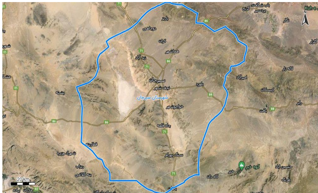
شکل ۱. تصویر مناطق روستایی شهرستان سیرجان